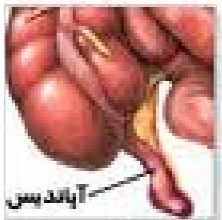
قبل از عمل