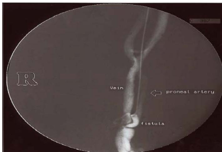
تصویر ۱. آنژیوگرافی قبل از عمل آمبولیزاسیون

بیمار مرد ۵۳ ساله ای بود. که ۲۹ سال قبل در جنگ تحمیلی مورد اصابت ترکش قرار گرفته بود. به دنبال آن بیمار دچار تورم اندام تحتانی و نارسایی وریدهای اندام های تحتانی شد. بیمار ۱۴ سال قبل تحت عمل جراحی قرار گرفت که بهبودی در علائم وی ایجاد نشده و به تدریج علائم وی تشدید یافت و مبتلا به واریس شدید، تورم و خستگی اندام تحتانی راست