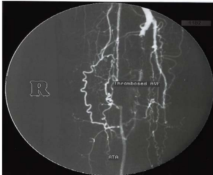
تصویر ۳. بسته شدن فیستول شریانی- وریدی پس از آمبولیزاسیون کامل

پس از چند دقیقه Coilها به صورت کامل در محل ترومبوزه شده و فیستول به صورت کامل بسته شد (تصویر ۳). بیمار دو هفته بعد مجدداً مراجعه نمود و علایم وی از قبیل تورم اندام، واریس، درد و احساس خستگی به صورت کامل بهبود یافته بود (تصویر ۴).