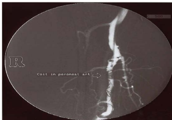
تصویر ۲. آنژیوگرافی بعد از عمل آمبولیزاسیون

که طی آن ارتباط غیرطبیعی بین شریان- وریدی ساق پا راست دیده می شود